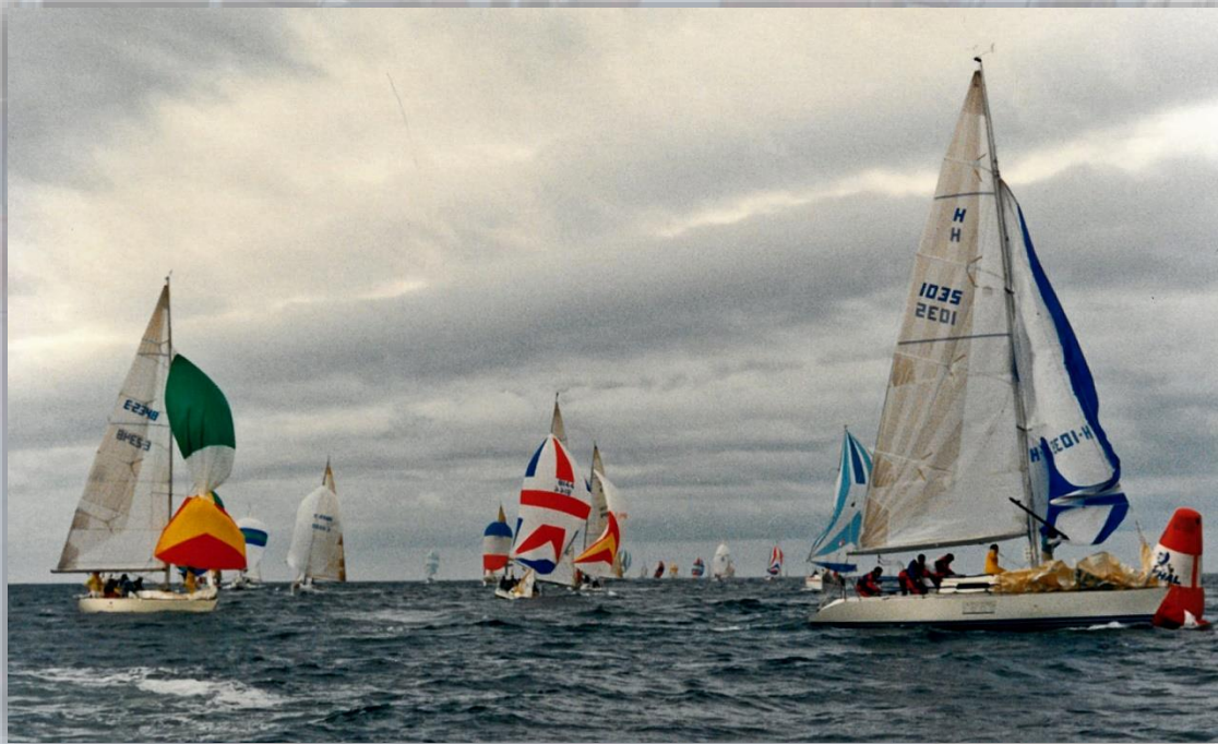
Trofeo Príncipe de Asturias 1986

Junto a las tradicionales pruebas deportivas, en las que todos tienen cabida (veleros de regata, cruceros, monotipos, clásicos...), el Trofeo Príncipe de Asturias incluye también desayunos, encuentros, charlas, conferencias, degustaciones, entregas de premios, fuegos artificiales, fiestas... Se trata, en definitiva, de un encuentro muy atractivo para que navegantes de todo el mundo puedan disfrutar juntos de la pasión que comparten: la vela.